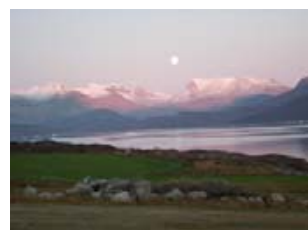
au bout du monde