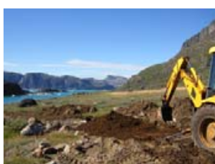
construction d'un chemin