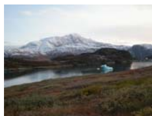
l'automne à Ipiutaq