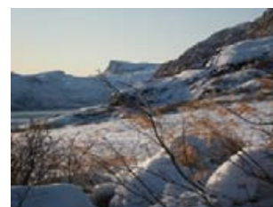
l'hiver à Ipiutaq