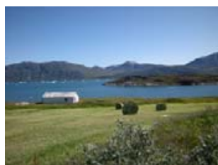
l'été à Ipiutaq