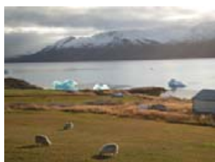
glaces et moutons