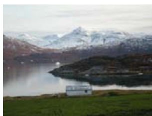
le printemps à Ipiutaq