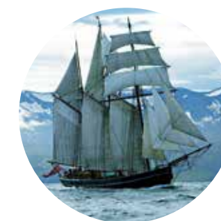
Трёхмачтовый деревянный парусник Aciv 1952 года