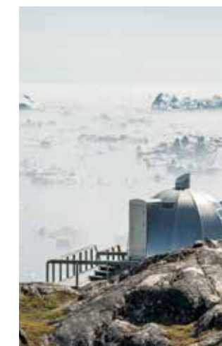
Летом Гренландия поражает контрастами – вдоль зелёных берегов, устланных травами, цветами и ягодами, проплывают куски айсбергов.

А если на вашей лодке (вдруг, совершенно случайно) окажется титулованный шеф-повар из известного ресторана и бармен с чемоданчиком, полным шейкеров и прочих гаджетов, то, уверяю вас, подобная поездка станет номером один в вашем списке, даже если вы уже побывали в половине стран земного шара.