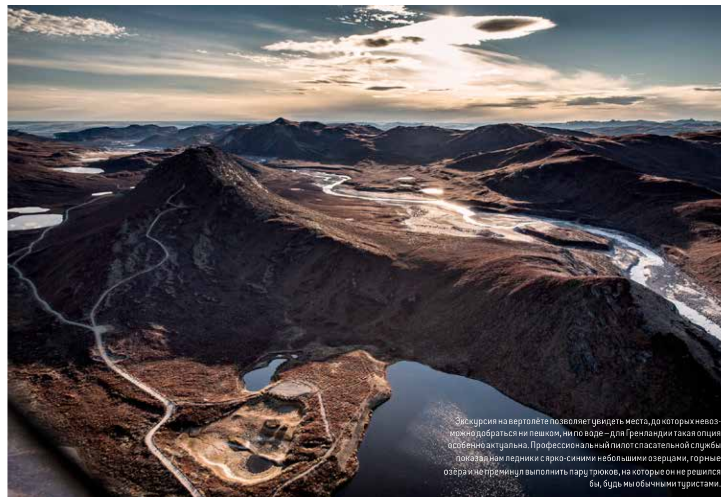
Экскурсия на вертолёте позволяет увидеть места, до которых невозможно добраться ни пешком, ни по воде – для Гренландии такая опция особенно актуальна. Профессиональный пилот спасательной службы показал нам ледники с ярко-синими небольшими озёрцами, горные озёра и не преминул выполнить пару трюков, на которые он не решился бы, будь мы обычными туристами.

Основной этап экспедиции стартует в 2015 году, но уже сейчас проводятся предварительные пробные проходы вдоль берегов Гренландии с учёными на борту.