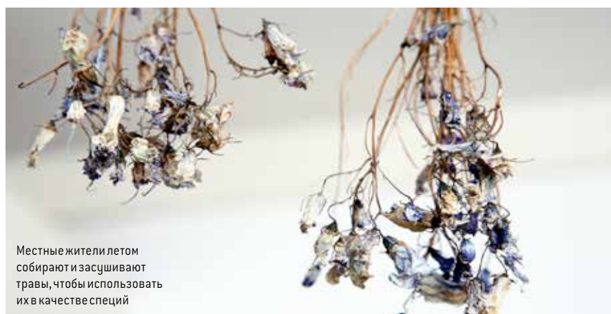
Местные жители летом собирают и засушивают травы, чтобы использовать их в качестве специй

Сайт Агаты Дэвизм http://www.ipiutaq.com/reception.html Официальный туристический портал Гренландии http://www.greenland.com/en/ Сайт фонда Foundation Mamont http://mamontfoundation.wordpress.com/about-mamont-foundation/