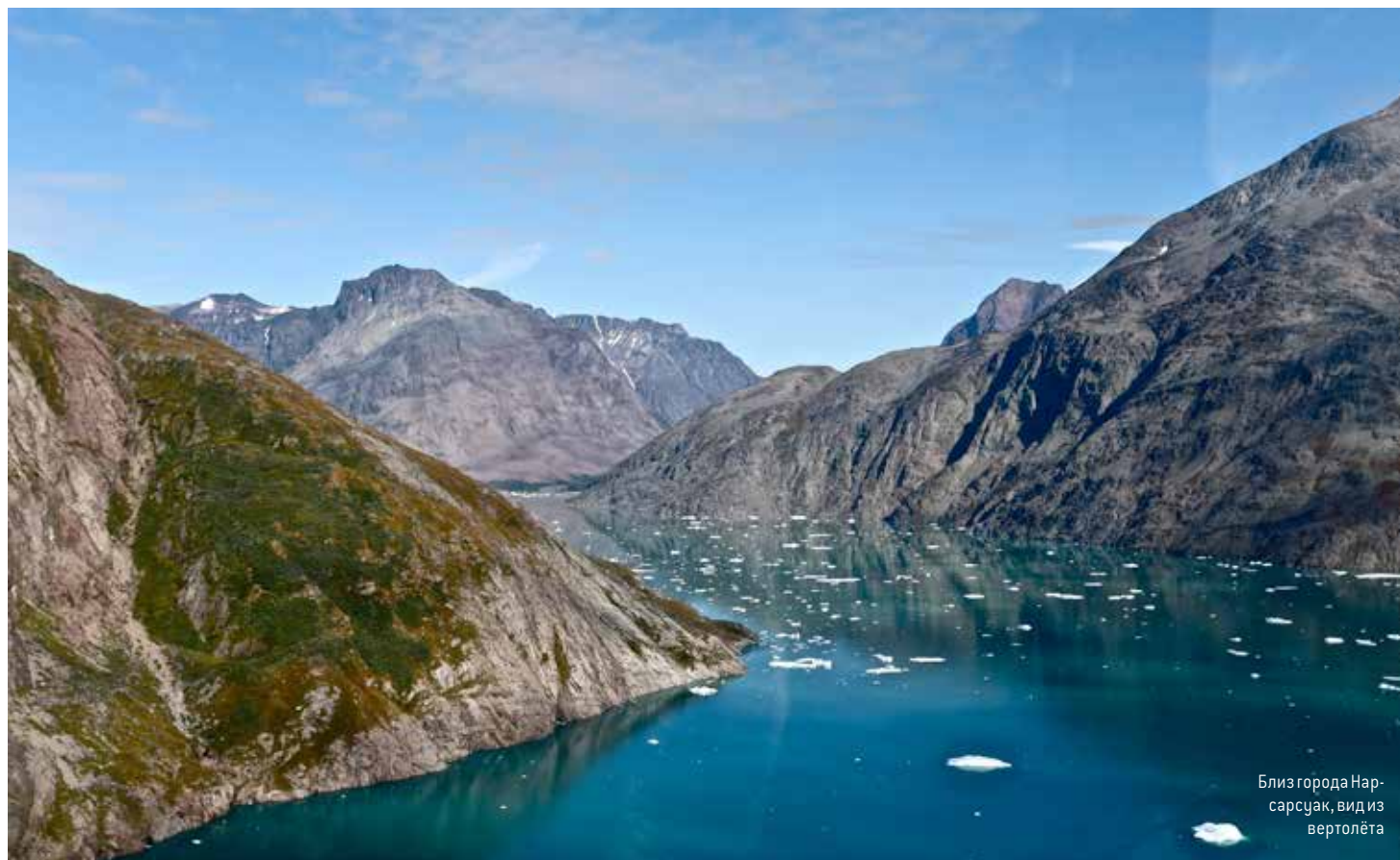
Близ города Нарсарсуак, вид из вертолѐта