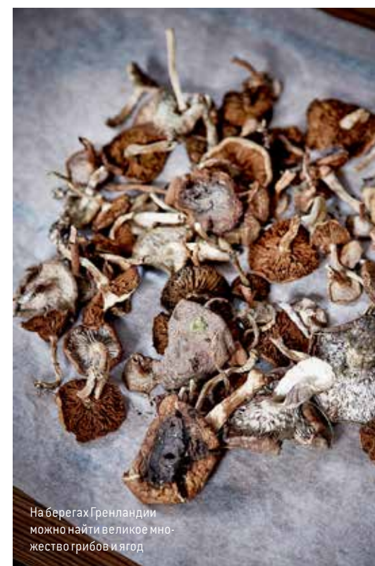
На берегах Гренландии можно найти великое множество грибов и ягод

Вообще, впечатления от Гренландии настолько же яркие, насколько и труднодоступные. Просто приехав в столицу страны и организовав себе несколько пеших туров, многого не увидишь. В местных городах – решительно нечего делать, расстояния –