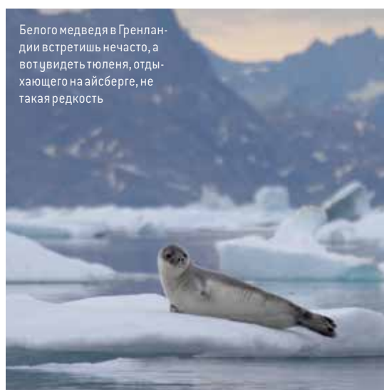
Белого медведя в Гренландии встретишь нечасто, а вот увидеть тюленя, отдыхающего на айсберге, не такая редкость