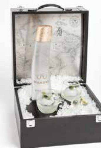
«Goutte de l'arctique» («Капля Арктики») – блюдо от победителей состязания Mamont Circumpolar Mission