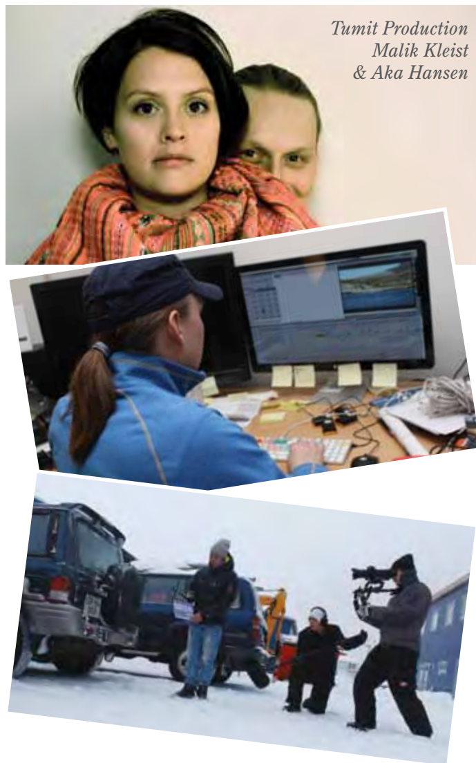
Tumit Production Malik Kleist & Aka Hansen